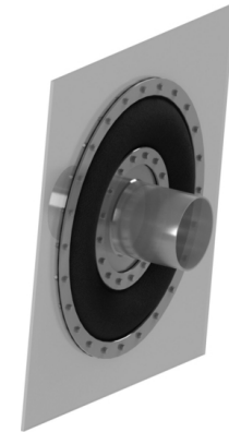
Anmerkung | Typ 35 - Weichstoff-Kompensator | 3D Ansicht

Detaillierte technische Spezifikationen für Gewebekompensatoren des Typs 35 finden Sie in der folgenden Tabelle und in den Dokumenten oder kontaktieren Sie uns .